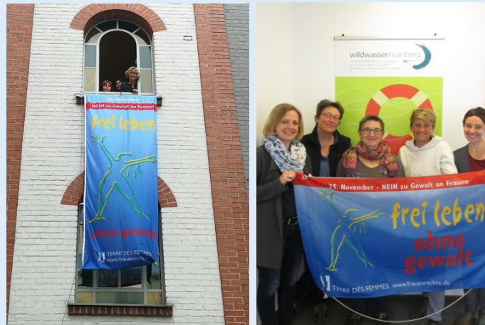
Fahnenaktion 2017 im Zentrum Kobergerstraße (links, ©Zentrum Kobergerstraße) und bei Wildwasser Nürnberg e.V. (rechts, ©Wildwasser Nürnberg e.V.)