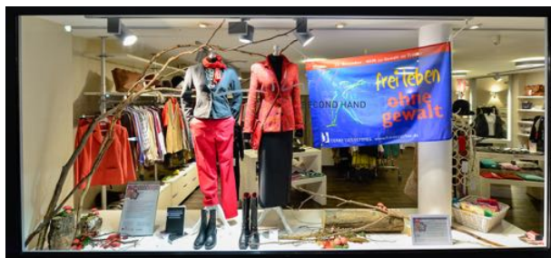
Lilith e.V. Second Hand Laden, Fahnenaktion 2017.

Weitere Veranstaltungen rund um den Antigewalttag werden zeitnah bekannt gegeben auf frauenrechte.de/online/termine nuernberg.de/internet/frauenbeauftragte/veranstaltung