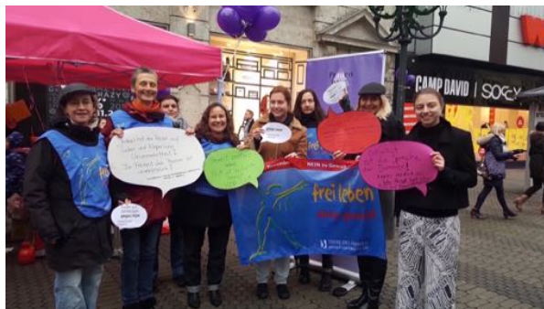
Die TDF-SG bei der Sprechblasenaktion 2017 am Ehekarussell.

Kontakt: Susanne Meister nuernberg@frauenrechte.de