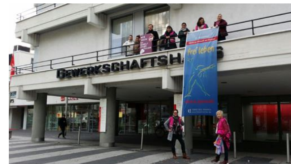
DGB, Gewerkschaftshaus, Fahnenaktion 2017.

Herzlichen Dank an das Team der Frauenbeauftragten der Stadt Nürnberg für die solidarische Unterstützung!